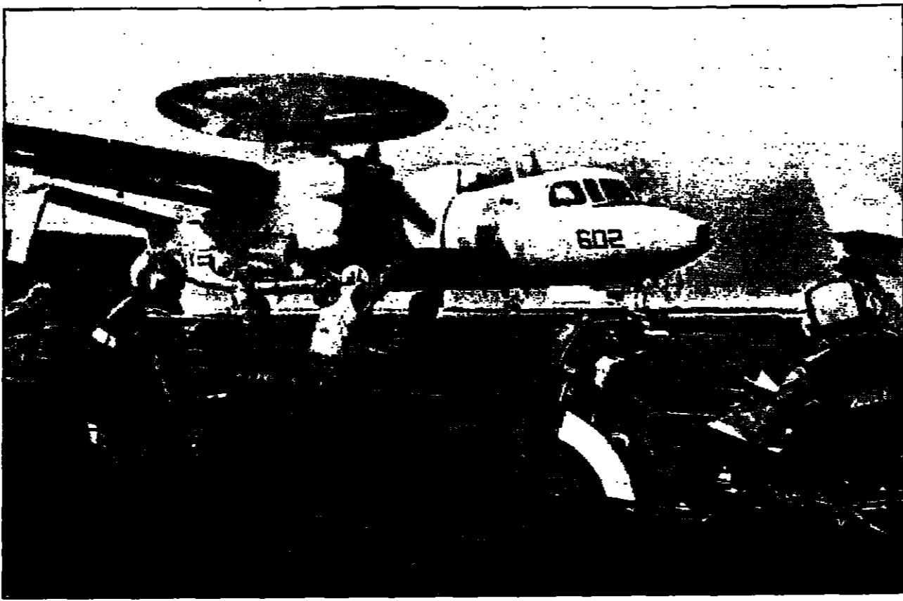
طائرة أمريكية لانزال للمركب تستعد للانطلاق في مهمة جديدة فوق العراق

ستبقي صواريخ كروز بالخليج ضعف ما كان قبل الازمة مع العراق